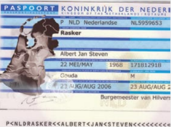
Het document waar alles om te doen was

plicht tuinkabouters een hand moet schudden, al is dat tegen mijn geloof, dat gaat nog. Maar dit ging te ver", aldus Jabalagal. Verbonk was echter onverbiddeijk. "We zijn nou eenmaal een gezellig landje", aldus de minister. "En wie hier wil wonen moet zich aanpassen aan Nederland".